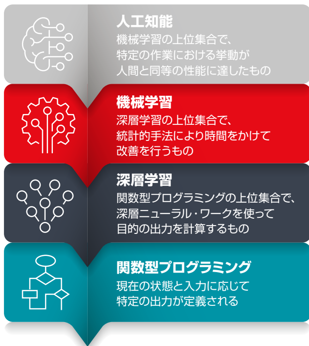
図2：AIの研究と応用の範囲は広く、自動化された製造システムなどの機械が自ら性能を改善し、新しい作業を学習できるようにする方法に特化したものもある。

現状では達成不可能なレベルにまで精度を継続的に向上させることに加え、AI技術は、今はまだ難しすぎて検出できないようなパターンに基づいてパラメータを定義できるようになると期待されています。例えば、一見して同一の運転を行う組立ラインが別のラインよりも生産高が少ないのはなぜか、といった問題にプロセスの専門家が当惑しているような場合でも、データ・マイニングによって予想外の変数の中に答えが示されるかも知れません。