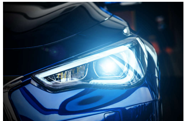
図 1-2. ヘッドライトと方向指示モジュール