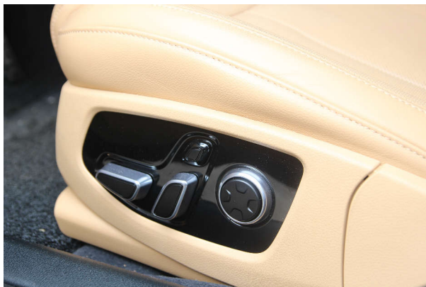
図 1-1. シート位置とコンフォート スイッチギア

テキサス インストルメンツが汎用車載マイコン分野に投入した最新の製品は、MSPM33C321A-Q1 です。MSPM33C321A-Q1 デバイスは、車載市場の現在のニーズに対応できるように設計されています。MSPM33C321A-Q1 デバイスは、AEC-Q100 認定デバイスとして現在も競争力のあるコスト構造を維持しつつ、現在の要件に対応するため、演算性能とアナログ性能の向上、および自動車グレードの安全性・セキュリティ機能を提供します。