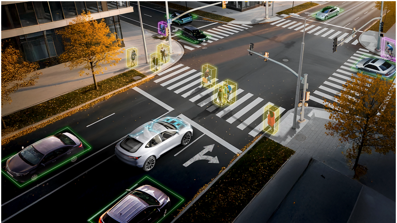
图 1. 分析環境資料之軟體定義車輛自動駕駛 ADAS 功能的視覺化

汽車產業正藉助中央運算平台提升至更高層級的車輛自動駕駛。像 TDA5 系列這樣的 SoC 透過整合式 C7™ NPU 與支援小晶片的設計，提供安全、高效率的 AI 性能。這些 SoC 讓汽車製造商能更輕鬆地實作 ADAS 功能，將高階功能帶入從基本車款到豪華轎車的所有類型車輛。