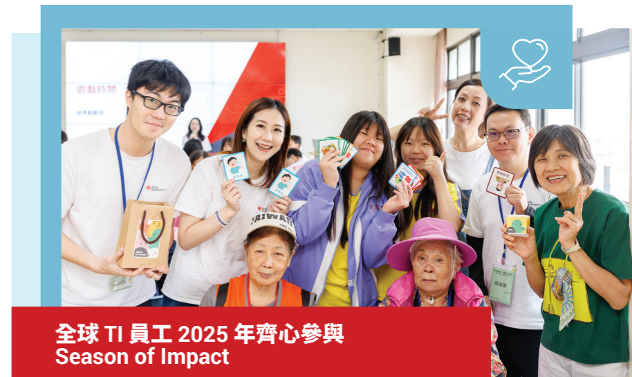
全球 TI 員工 2025 年齊心參與 Season of Impact

2025 年，員工與退休人員貢獻超過 251,000 小時志工時數，價值達 870 萬美元 3