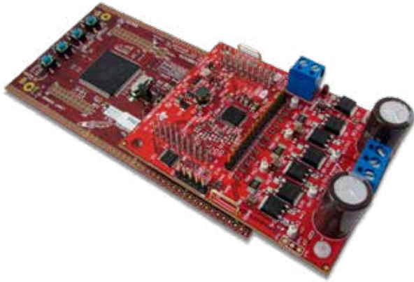
図3：DRV3245Q-Q1車載3相モーター・ゲート・ドライバの評価基板 (BOOSTXL-DRV3245AQ1)。

モーター・システム向けの安全性開発を開始できるように、さまざまなTI安全性ペリフェラルとともに出荷されている DRV3245Q-Q1評価基板 を、 Hercules™ TMS570LS12x LaunchPad™ 開発キット と組み合わせることをご検討ください。次の図3に、開発キットと組になっているDRV3245Q-Q1評価基板を示します。